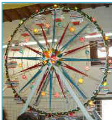
LA RUOTA PANORAMICA!