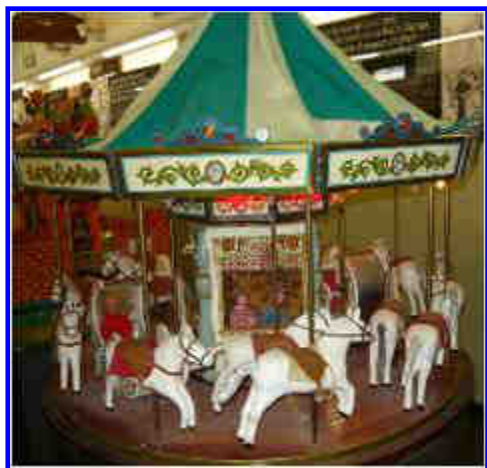
LA GIOSTRA DEI CAVALLI!