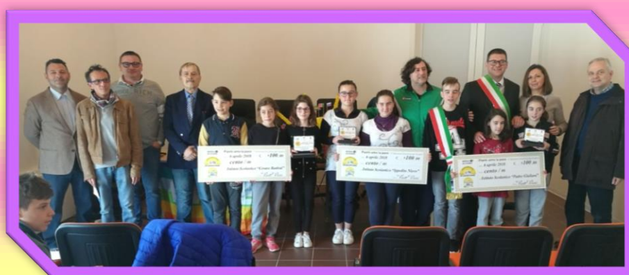
Foto di gruppo con componenti della giuria e rappresentanti alunni delle classi vincenti.